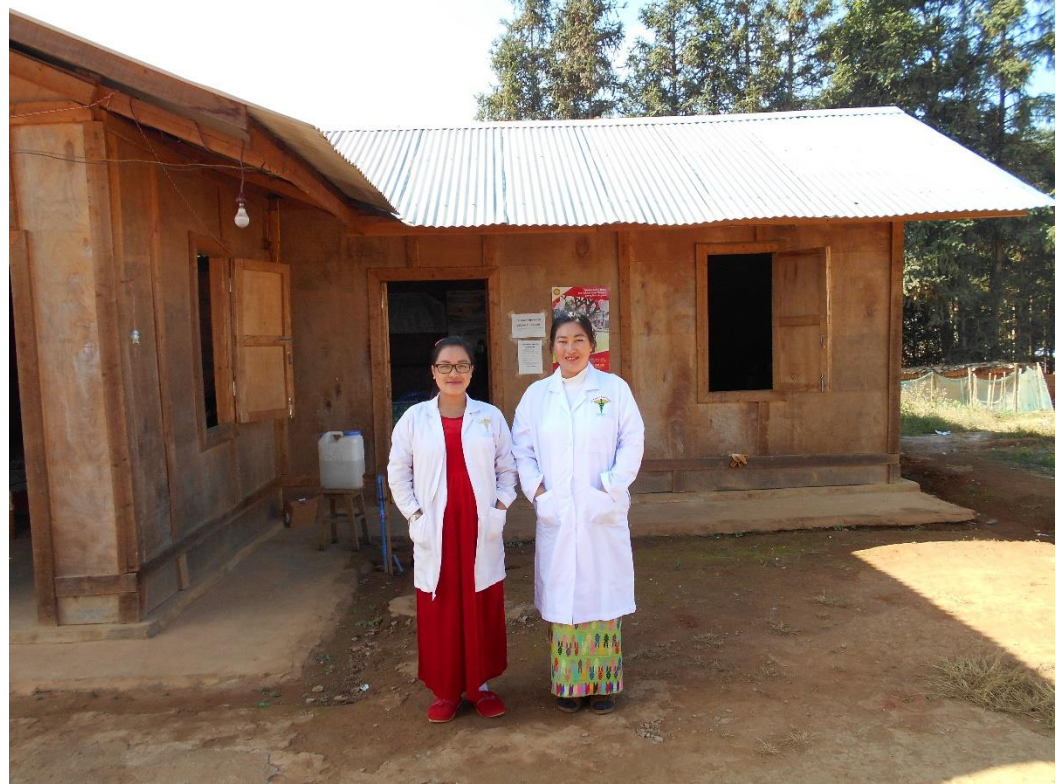
ခါတ်ပုံ-လွိုင်ဂျယ် (Loi Je) IDPs စခန်းမှ ဆေးခန်း