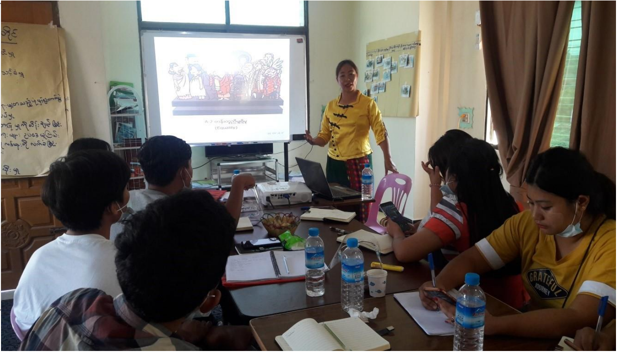
ဓါတ်ပုံ- မဲပေးသူများ ပညာပေးခြင်း TOT